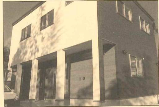
(NPO) かごしまハピネス 鹿児島県 キッズハウス・フレンド(放課後等デイサービス棟)