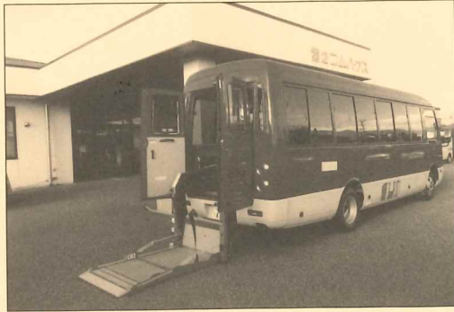
(社福) アルプス福祉会 長野県 第2コムハウス・ゆい(マイクロバス)