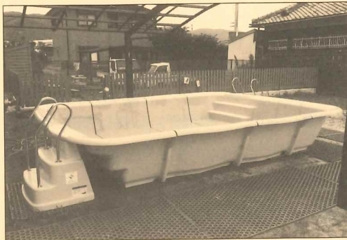
(社福) 桜樹 和歌山県 さくらんぼ園(簡易プール)