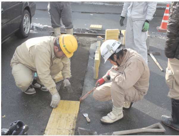
◀点字ブロックの修理