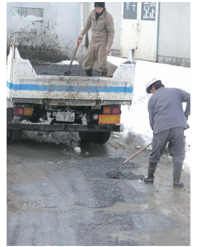
▶作業所進入路の整備