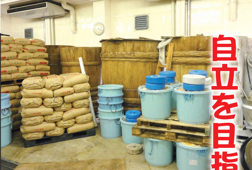
▲奥に並ぶ大きな木製の樽（4t）で味噌を熟成する。この大きな樽に味噌を出し入れする作業が大変とのこと。