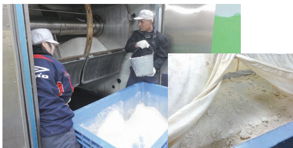
▲「こうじ」になる米を、蒸し上げる機械に入れる作業。（右は）蒸し上がった後、こうじ菌を混ぜ発酵中の状態。