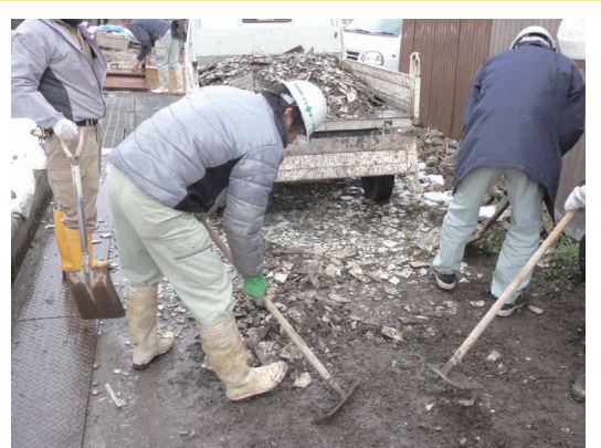
▲ボランティアルーム進入路の整備

丈夫で幅広いスロープを付けていただきありがとうございました。とっても移動がしやすいです。ありがとうございました。