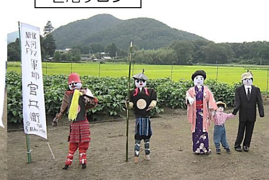
そね いんない さちの 曾根・院内・幸野サロン