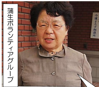
蒲生ボランティアグループ

「天花」は毎月第3金曜、その他随時活動しています。押し花を使って新生児に贈るお誕生カード、新1年生に贈るしおり作り、亡くなられた方へのおくやみカード等を製作しています。