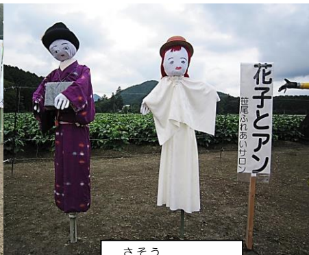
さそろ 笹尾サロン

今年もサロンや地域団体等で製作されたユニークな案山子たちが、あっぱれたんぼ（丹波自然運動公園隣接）を盛り上げています☆