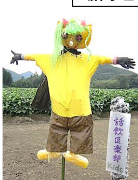
わいんくらぐらぶ 話飲区楽部Kids