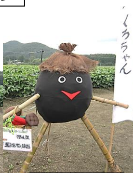
うえの 上野サロン