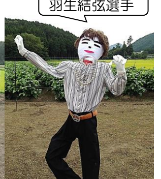
はにゅうゆづる 羽生結弦選手