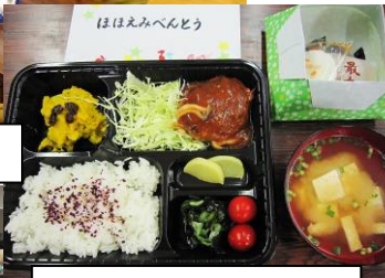
ほほえみべんとう

サラダ等)、手作りの帯び絵や箸袋など、さまざまな場面で感じられるおもてなしの心は、ほほえみの会会員に代々受け継がれています。