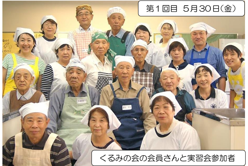
くるみの会の会員さんと実習会参加者