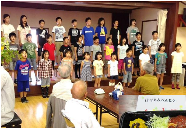
竹野小学校児童による合唱☆

小地域ボランティア「竹野ほほえみの会」主催の食事会が、6月2日(月)若竹センターにおいて開催されました。