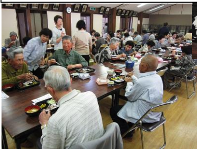
総勢60名の参加がありました!

食事会は竹野地区にお住まいのひとり暮らし高齢者、80歳以上の方を対象に、地域を越えた交流や楽しみの機会の創出を目的として約20年間続けられています。高齢の方が食べやすいようなメニュー(煮込みハンバーグ・かぼちゃ