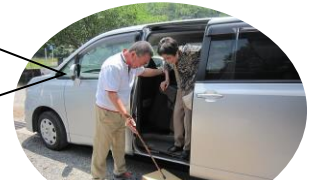
運転ボランティア