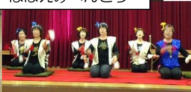
銭太鼓サークル「夢(ゆめ)」

食事の後は、竹野小学校児童による美しい歌声と、銭太鼓サークル「夢」による躍動感のある演奏が披露され、楽しいひと時となりました。