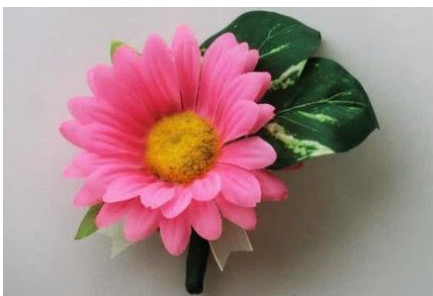
製作されたブローチ