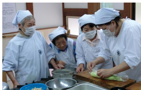
升谷区 (7月2日・実施)

「くるみの会」のご協力のもと、今年度第1回目のふれあい調理実習を升谷区を皮切りに開催中です。皆さん、調理も会話も楽しまれました。季節の野菜を使い、油ひかえめでヘルシーな献立となっています。7月23日の大簾区まで和知各地区で開催されます。