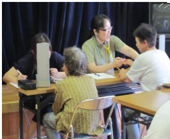
◆かんぼ生命ホームページより→