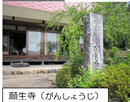
願生寺（がんしょうじ）

会場である「願生寺」は白土区を見下ろせる非常に高いところに位置するため、サロンに参加するだけで筋力UPの効果が期待できる点も魅力的です！男性の参加が増え、ますます元気な声が溢れている白土区ふれあいサロンです✿