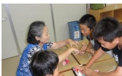
八田サロン：昔の遊び、給食、似顔絵プレゼント

「最近家の近くで子どもたちを見なくなって寂しい」という声をよく聞きます。交流会での小学生の姿を本当に嬉しそうにサロンの方々は見ておられました。この交流会の後も、地域での交流を深めていって欲しいな…と思っています。