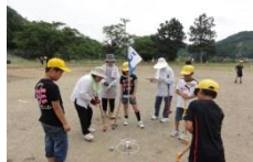
下村サロン：グラウンド・ゴルフ

瑞穂小学校4年生22名とふれあい・いきいきサロンの方との交流会が旧小学校区で開催されました。おじいちゃん・おばあちゃんのすごい！を発見したり、小学生のみんながあやとりが上手いのにビックリしたり！どのサロンでも笑い声のあふれる交流会となりました。