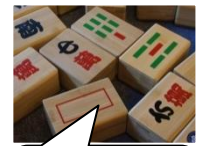
レク道具 コミュニ ケーション麻雀

その後は丹波「市森サロン」、瑞穂「質美下村サロン」、和知「篠原みつき会」のサロン活動報告があり、定期的な見守り活動を通して住民同士の交流を深め、明るく元気に過ごす工夫がそれぞれの地域で発表されました。終了後のアンケートには、「他地域の活動を知り、自分達の取り組みを振り返る良い機会となった」との声がありました。