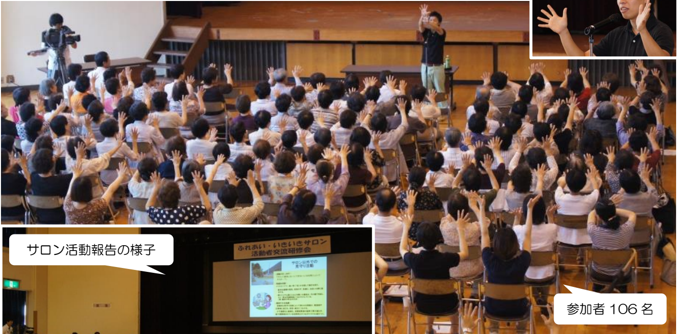
サロン活動報告の様子