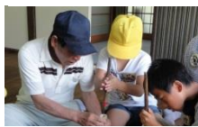
栗野サロン：水鉄砲、七夕飾り作り