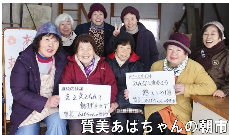
質美あばちゃんの朝市 アピール文【みんなに出会える憩いの場】