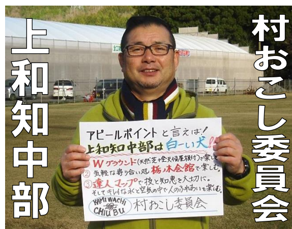
上知中部 村おこし委員会 アピール文【キレイな水と空気の中での人とのふれあい】

京都府内 25 の市町村社協ではサロンを中心とした様々な活動が展開されています。こうした活動は交流から見守り、支え合いとなり、地域での安心した暮らしにつながっています。