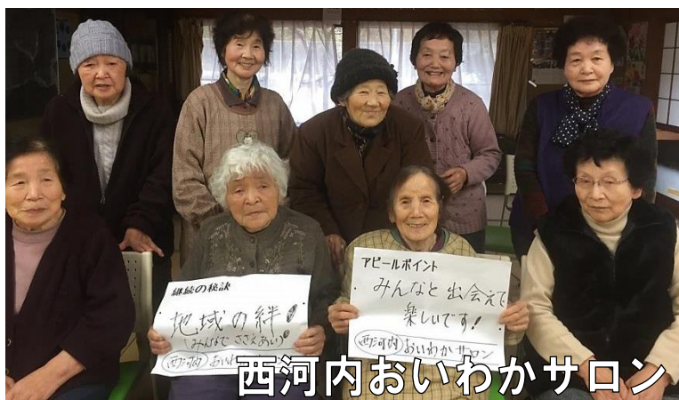
西河内おいわかサロン アピール文【みんなと出会えて楽しいです!】