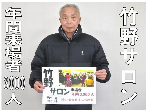
年間来場者 3000人 竹野サロン アピール文【行く・会える・しゃべれる】

1月28日(土)、京都府下で地域を支える活動をされている団体、活動者の交流・活動発表が八幡市文化センターで行われました。今回は「あなたの自慢大募集！」として、活動写真の展示コーナーが設けられ、京丹波町からは4団体の出展がありました。