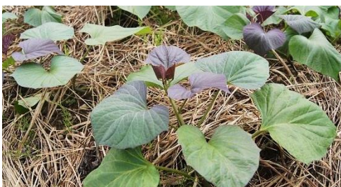
安納芋 (葉が勢い良く育っています)