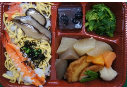
献立 ← ばら寿司、野菜の煮物、菜の花のからし和え、黒豆ゼリー 京田辺市調理グループからデザートに手作りの「オレンジムース」を頂きました☆