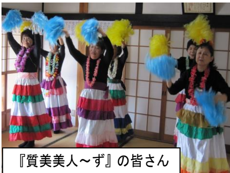
『質美美人〜ず』の皆さん

いつもおしゃべりと笑い声が絶えない、明るい白土サロン。この日は質美地域から『質美美人〜ず』のメンバーが参加され、花笠音頭や懐かしの歌謡曲に合わせた華やかな踊りを披露していただき、いつもにも増して、とても賑やかで、活気溢れるサロンになりました(^v^)