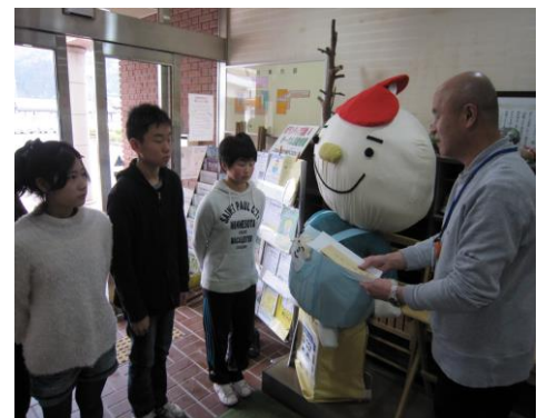
↑ 芽生会代表の皆さん/丹波支所にて

児童ひとりひとりの気持ちが込められた“車いす募金”で、新たに車いすを購入させていただき、町民の皆さまに広く活用していただきます。