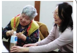
お箸・出し入れゲーム