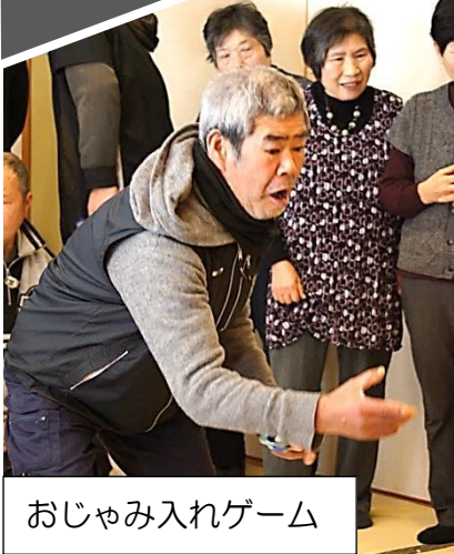
おじゃみ入れゲーム

1月22日(水)、道の駅「和」で毎年恒例の交流会が行われました。昼食後はビンゴゲーム、おじゃみ投げゲームなどをして盛り上がりました。また二人羽織も企画され、マシュマロが口に入る度に笑いと拍手が起こっていました。今回は過去5回の交流会の写真展示があり、懐かしい会話が自然と生まれていました。