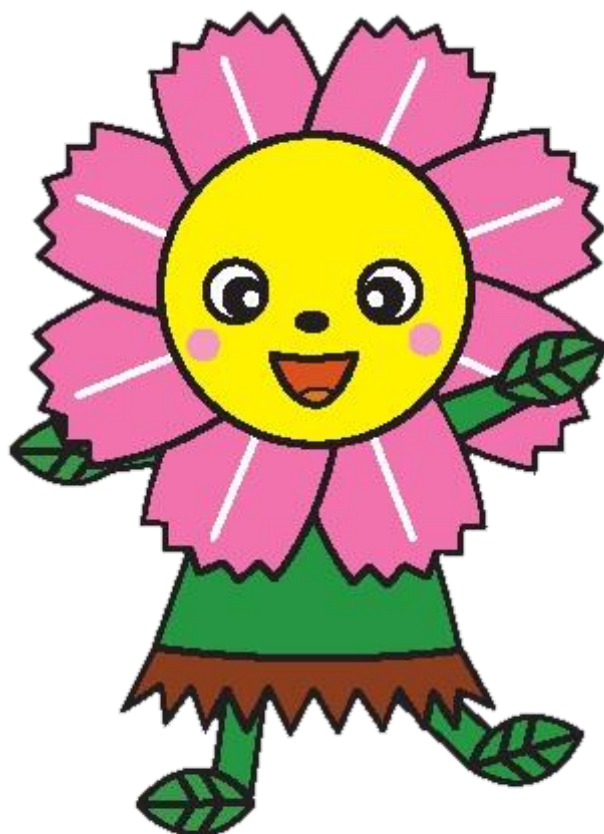
ハッピーコスモスちゃん