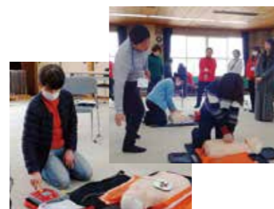
胸骨圧迫とAED使用の体験