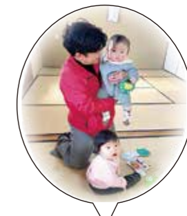
講義中、私たちはお留守番です(託児中)