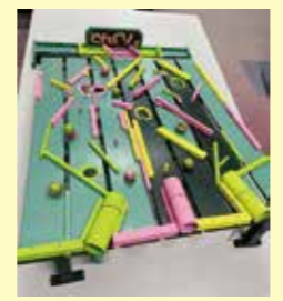
どんぐりコロコロ2

白ゆり会様 雑巾50枚、おしぼり10枚 西木津川台支部様 ゲーム(どんぐりコロコロ2) 匿名 10,000円(こすもすカフェのために) 匿名 5,000円 匿名 小松菜、ほうれん草、大根、すだち、おにゆず、菊菜、 水菜、にんじん、ゆず