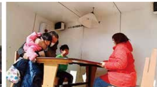
起震車体験 震度7を体験しました。