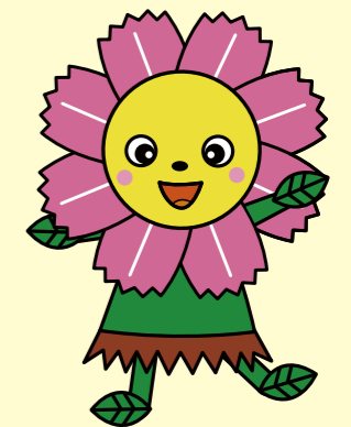
ハッピーコスモスちゃん