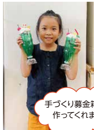
手づくり募金箱を作ってくれました