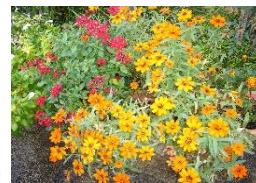
前回、植えた百日草 10/31撮影

十一月二十二日、『城陽市花いっぱい運動』を実施。苑の花壇で、陽和苑で募った有志の皆さん（お馴染みのメンバーが中心）と職員が、チューリップなどを植えました。