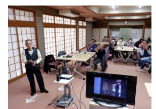
カラオケサロンの様子