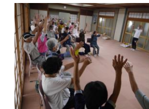
生き生きサロンの様子