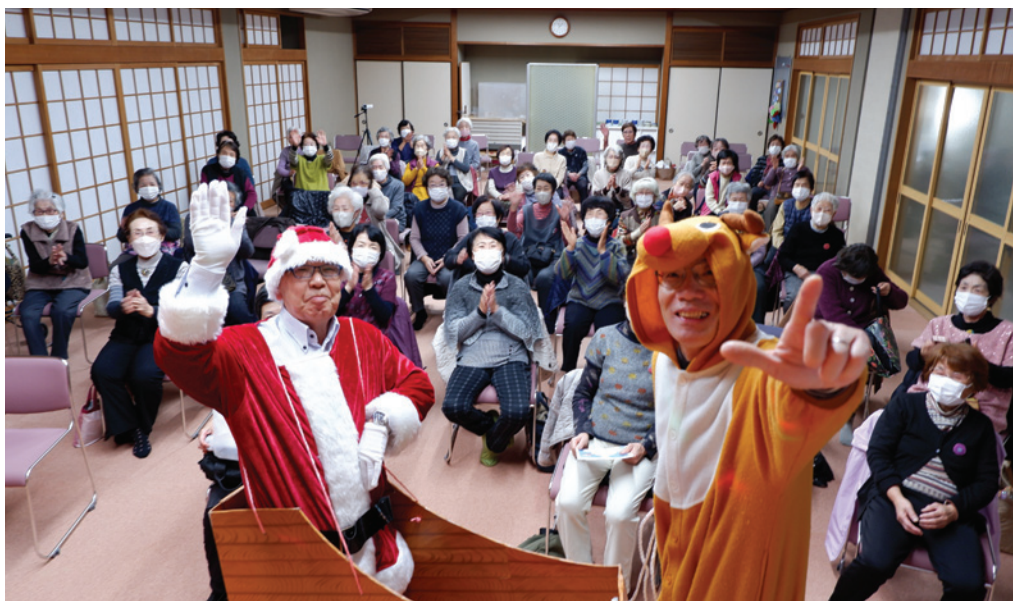
生き生きサロン・ほほえみ会 合同サロン クリスマス会