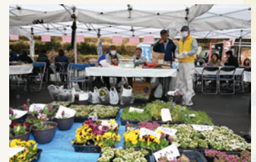
ふれあい福祉まつり模擬店