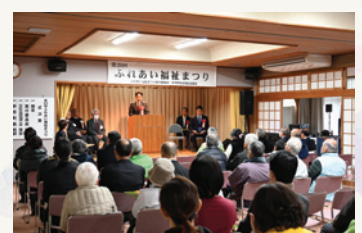
ふれあい福祉まつり式典