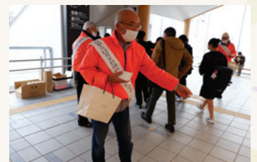
障害者週間街頭啓発