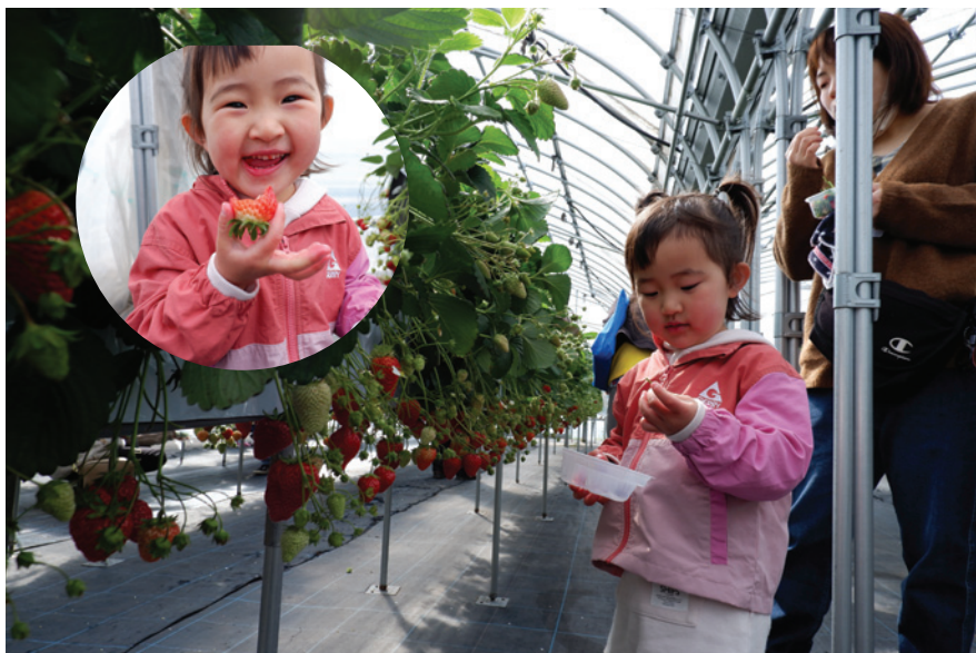
子育てサロン イチゴ狩り