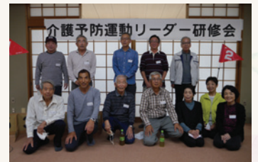
介護予防運動リーダー研修会