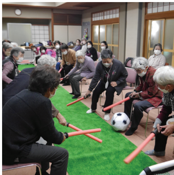
生き生きサロン 棒サッカー