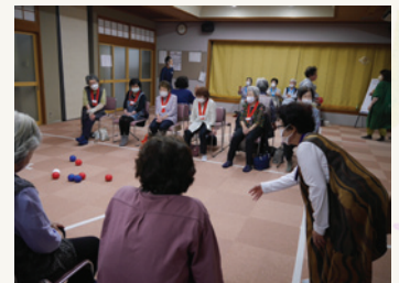
生き生きサロン(ポッチャ)