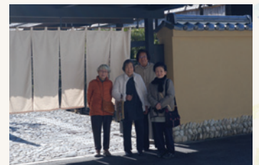
家族介護者交流事業