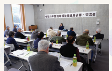
地域福祉推進員研修・交流会