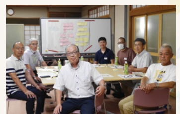
地区別ワークショップ