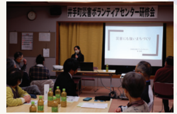
災害ボランティア