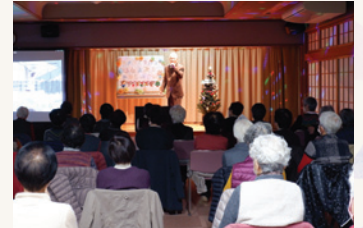
合同サロン（クリスマス会）